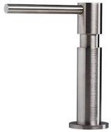
Dispensador Evo Satinado 8520 100